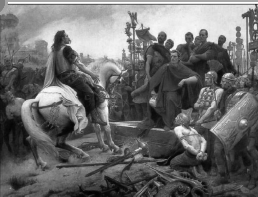
Vercingétorix jette ses armes aux pieds de Jules César, toile de Lionel-Noël Royer, 1899