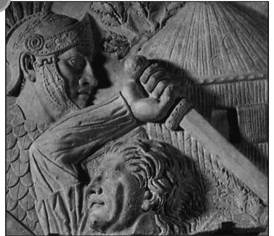
Gaulois combattant un légionnaire romain, Début du II ème s. av. J.-C. (Rome)