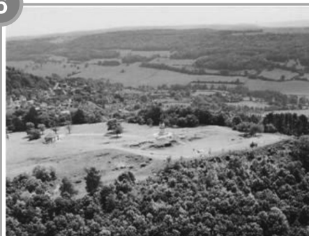
L'oppidum d'Alésia aujourd'hui