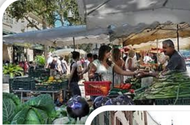
← Un marché (ou halles)