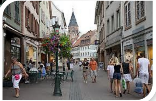
Zone piétonne (nombreux commerces) →