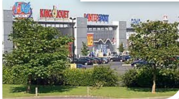
← Zone d'activité commerciale

6 Entoure les paysages du commerce que l'on trouve en centre-ville :