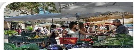
← Un marché (ou halles)

En ville les paysages de commerce prennent des allures variées : - Les marchés installés dans les rues ou les halles proposent surtout des produits alimentaires frais. - Les petites boutiques et les supermarchés sont surtout en centre-ville, souvent dans des zones piétonnes. - Les services (banques, assurances...) sont en centre-ville - En périphérie, les centres commerciaux et des zones d'activité commerciale regroupent des hypermarchés, des grandes surfaces spécialisées, parfois des cinémas, restaurant (fast-food)... - Les usines polluantes, bruyantes ou à risque sont implantées dans les zones industrielles en périphérie.