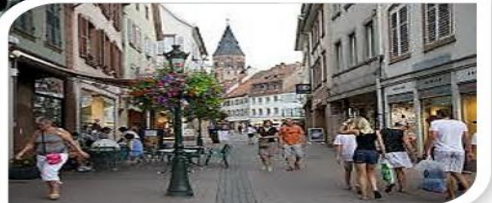
Zone piétonne (nombreux commerces) →