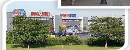
← Zone d'activité commerciale