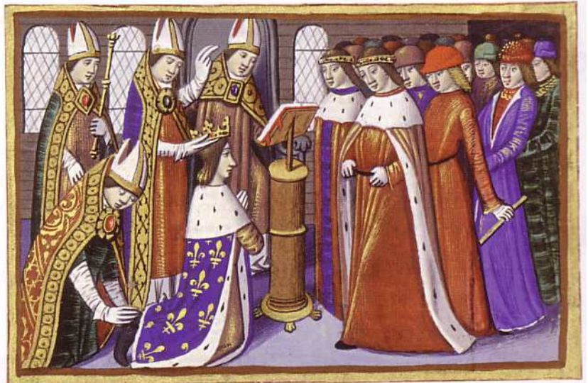
Le sacre du roi Charles VII, 17 juillet 1429 (miniature du xv e siècle).