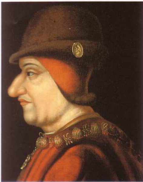
Portrait anonyme de Louis XI (fin du xv e siècle).