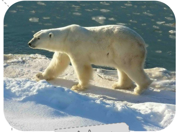
Sur la banquise

La couleur blanche lui assure un très bon camouflage sur la banquise.