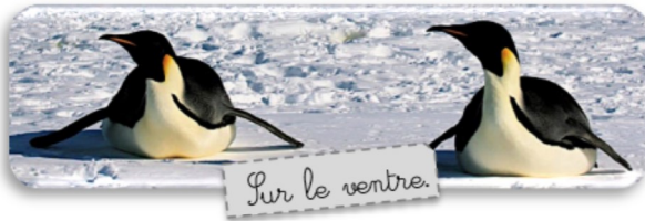
Sur le ventre.