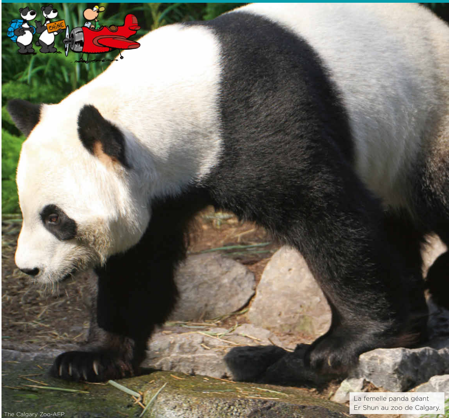
La femelle panda géant Er Shun au zoo de Calgary.