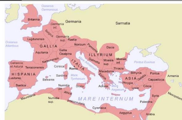
Empire romain d'orient et d'occident