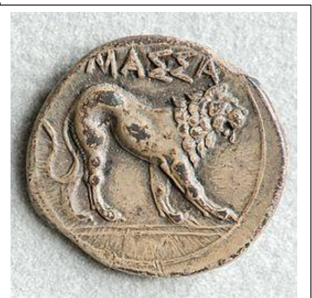
Pièce de monnaie grecque retrouvée à Marseille