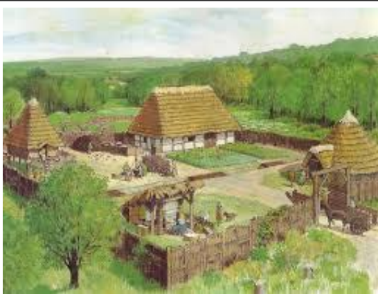
Habitat celte (gaulois)

Des Grecs ont quitté l'Asie mineure pour fonder des cités comme Marseille (vers -500 avant J.C) et faire du commerce autour de la Méditerranée. Ils font partie d'une brillante civilisation qui influencera d'autres civilisations et jouera un grand rôle dans le développement des arts et des sciences en Occident.