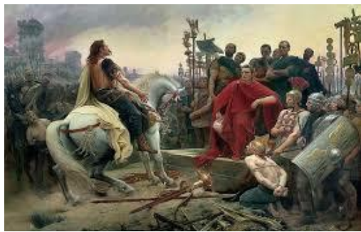
Vercingétorix devant Jules César

Une civilisation originale naît : la civilisation gallo-romaine qui va prospérer grâce à la paix romaine.