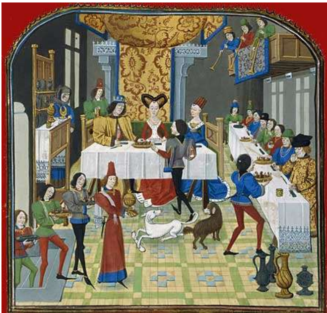
Miniature, XV e siècle (BNF, Paris)

Sur cette image, tu peux voir une réception donnée par un seigneur.