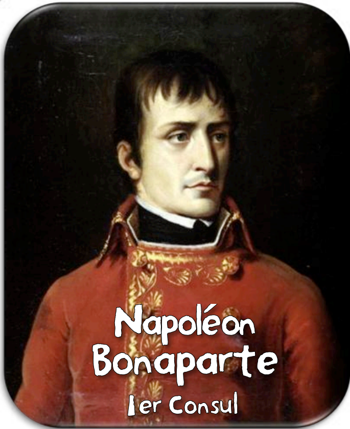
Napoléon Bonaparte 1er Consul