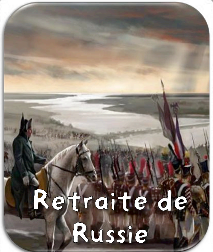
Retraite de Russie