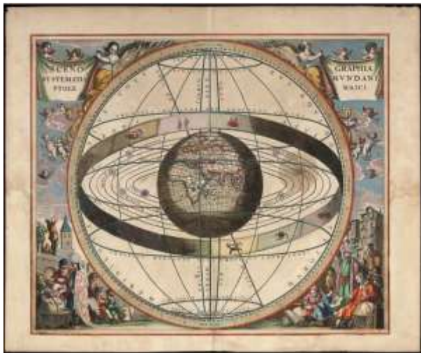
Modèle du « Système solaire » hérité de l'Antiquité

Les images suivantes représentent la manière dont les hommes voyaient le système solaire au Moyen-Age (image de gauche) et aux Temps Modernes (image à droite).